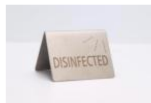
Seite 2 "Desinfected"