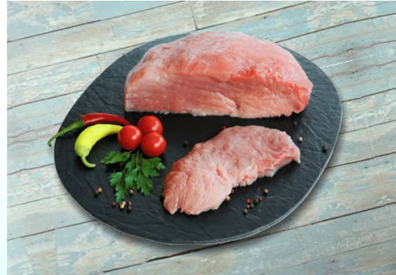
Lindenhof Frische Schweineoberschale ohne Deckel Stück ca. 1,6 kg / Karton ca. 20 kg Art.-Nr.: 031247