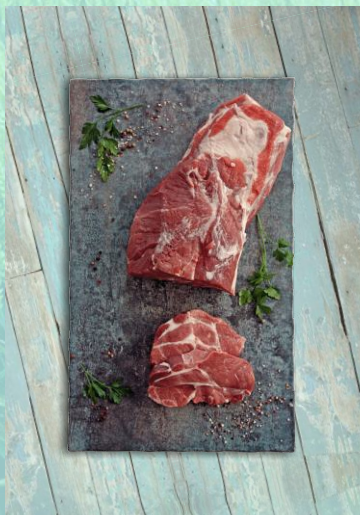
Lindenhof Frischer Schweinenacken ohne Knochen Stück ca. 2,5 kg Karton ca. 20 kg Art.-Nr.: 031248