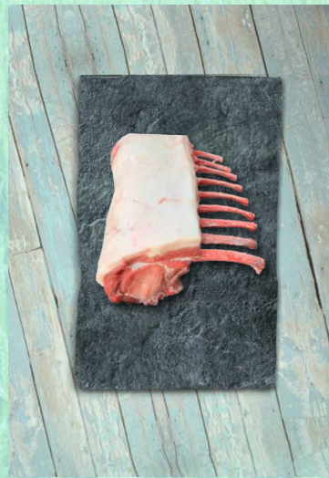
Lindenhof Frische Schweinekarree Racks, mit Knochen Stück ca. 3 kg Art.-Nr.: 031299