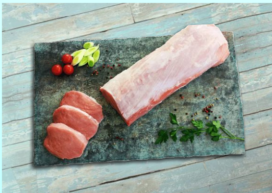
Lindenhof Frischer Schweinelachs ohne Knochen, ohne Kette Stück ca. 3 kg / Karton ca. 20 kg Art.-Nr.: 031249