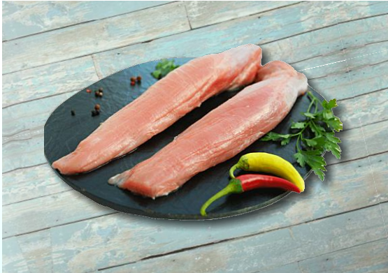
Lindenhof Frisches Schweinefilet lang, mit Kopf, ohne Kette Pack ca. 3 kg / Karton ca. 20 kg Art.-Nr.: 031246