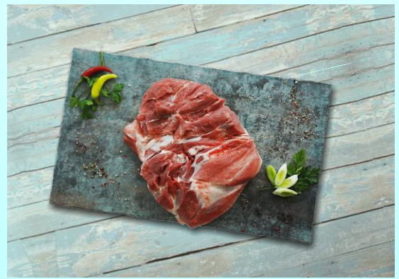
Lindenhof Frische Schweineschulter schier Stück ca. 5 kg / Karton ca. 15 kg Art.-Nr.: 031261