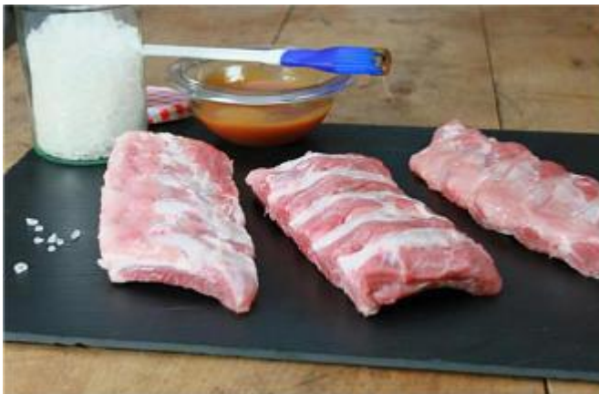
Spareribs, ungewürzt (dünne Rippe) frisch Pack 400 - 500 g Art.-Nr.: 020107