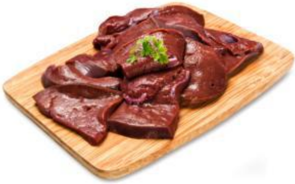
Rinderleber, frisch, vacu geschnitten, ohne Haut Stück 100 - 140 g | Pack 6 kg Art.-Nr.: 026016