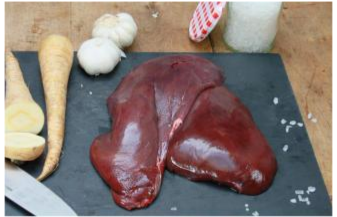
Schweineleber, frisch, portioniert Stück 80 - 140 g Art.-Nr.: 030614