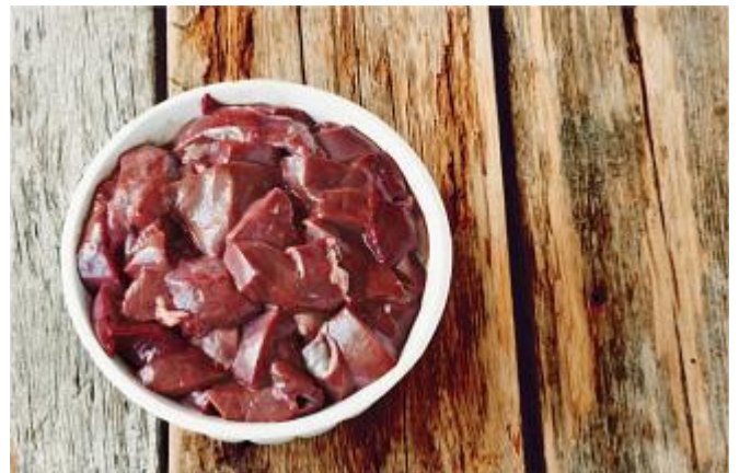
Schweineleber geschnetzelt, frisch Abpackung nach Wunsch Art.-Nr.: 030559